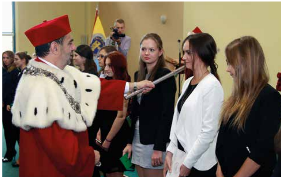
Uroczysta immatrykulacja studentów pierwszego roku