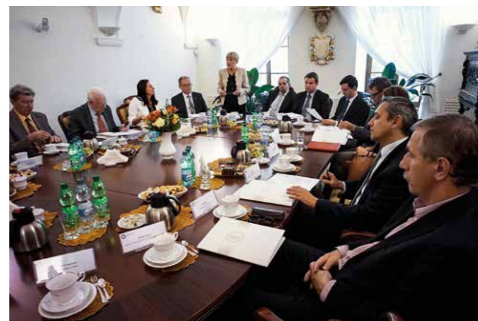
26 IX 2016. W Sali Plafonowej Collegium Maius obradowała Kapituła Honorowa kierunku lekarskiego