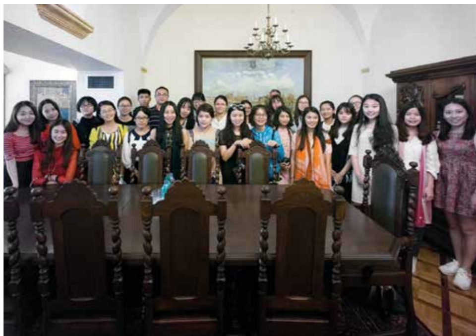
12 VII 2016. Studenci z Uniwersytetu Fujian – uczestnicy Letniej Szkoły J zykowej