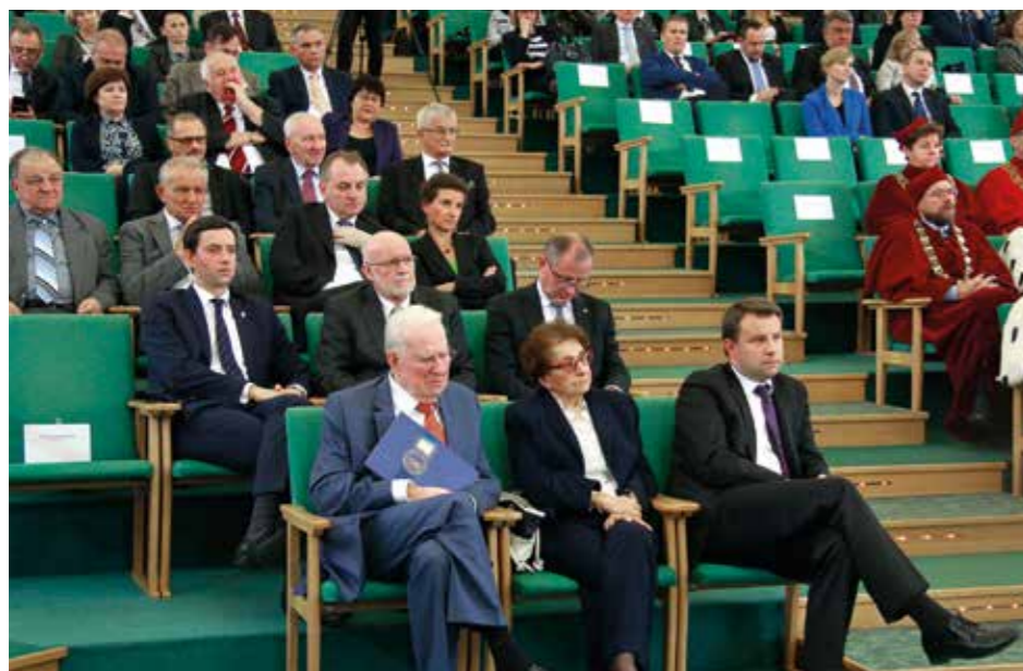
Goście uroczystości

nansowania uczelni. Po to, by skończyć z promowaniem i wyczerpieć liczebność studentów, co skutkuje devaluacją wartości dyplomów, a zacząć promować jako nauczania.