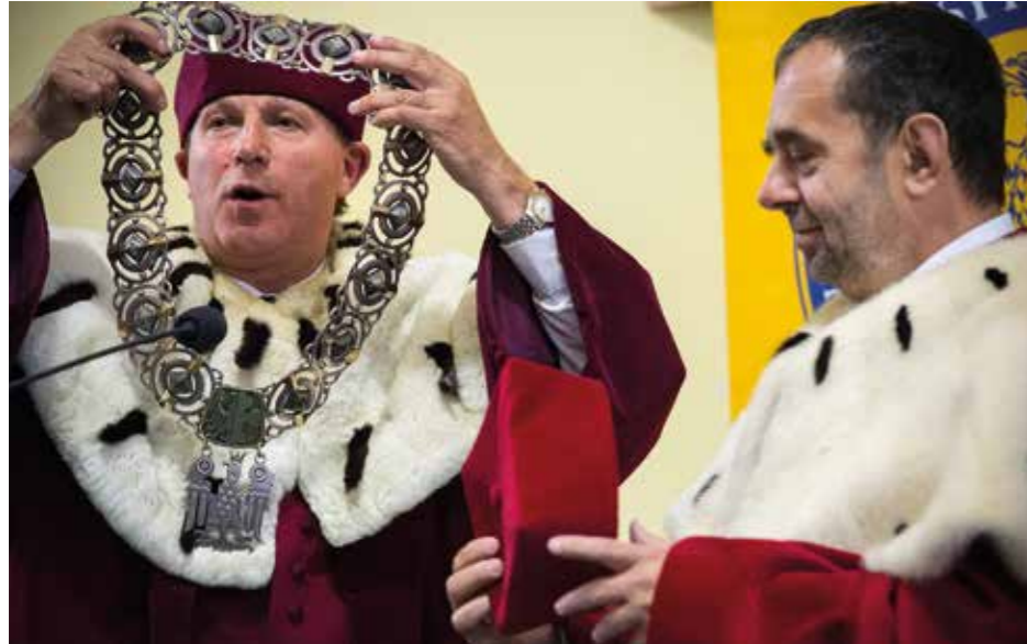
Symboliczne przekazanie insygniów władzy rektorskiej