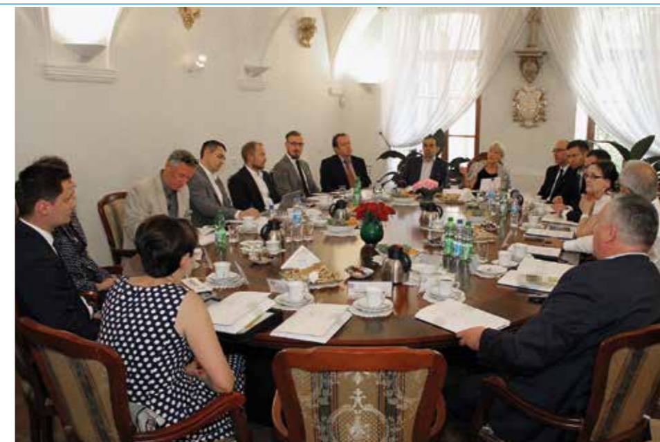
21 VII 2016. Na Uniwersytecie Opolskim odbyło się spotkanie dotyczące powołania o rodka studiów politycznych, dialogu i stosunków międzynarodowych oraz centrum strategii i bezpieczeństwa energetycznego