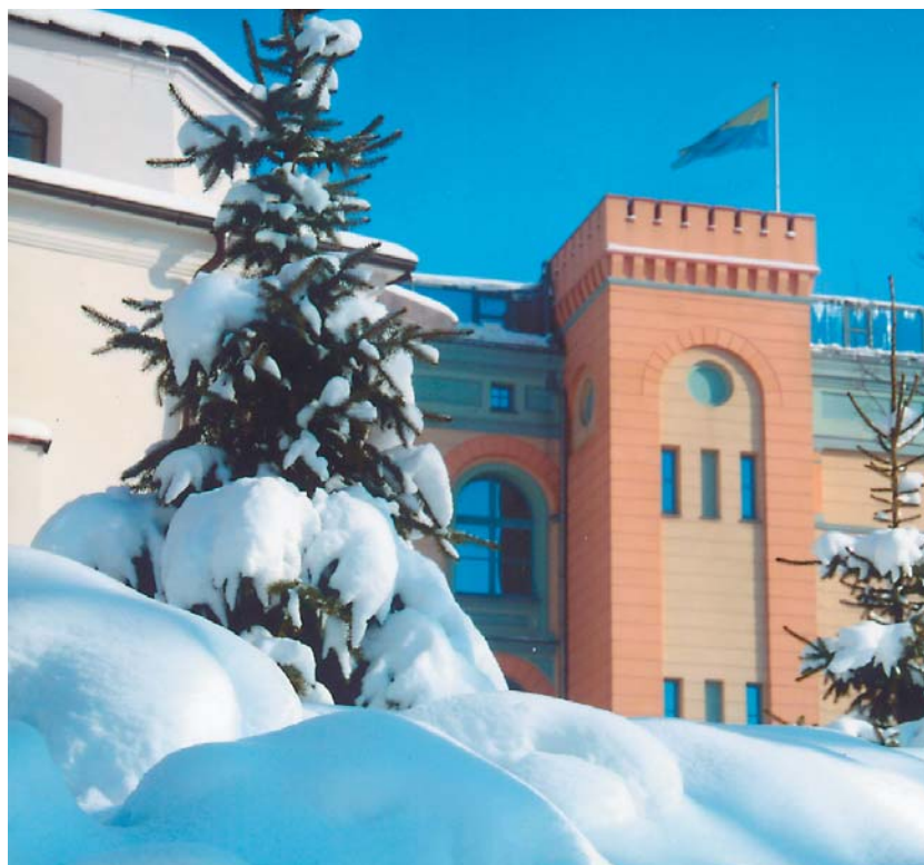
Zima przed Collegium Maius (zeszłorocznym śniegiem sypnął Jerzy Mokrzycki)

Pełna oferta Wydawnictwa Uniwersytetu Opolskiego znajduje się na stronie internetowej wydawnictwa www.wydawnictwo.uni.opole.pl tam też działa księgarnia internetowa