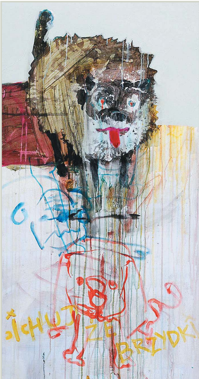
Michał Kałuziński, Prawa ręka zniszczenia , akryl, płótno