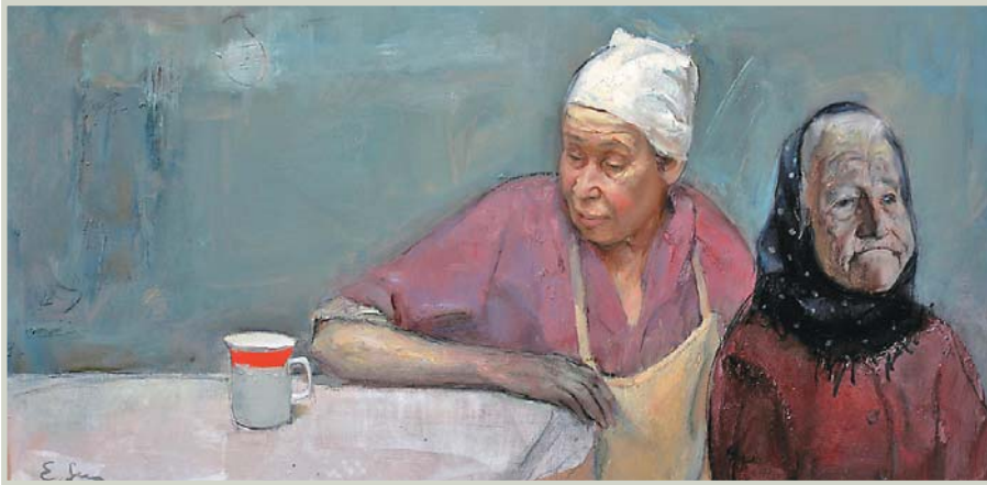
Edward Szczapow, Wieczór , olej, płótno